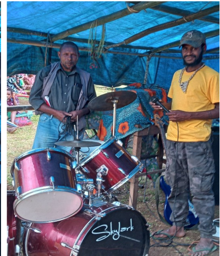
Musik im Gottesdienst