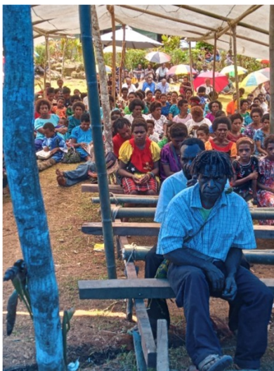
Bei einem Bibel-Treffen

Seit über 20 Jahren haben die Dekanate Kabwum und Cham. Man besucht sich, betet für einander und tauscht Briefe und Bilder aus.