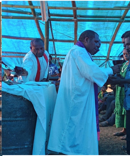
Ein Pfarrer verteilt Abendmahl